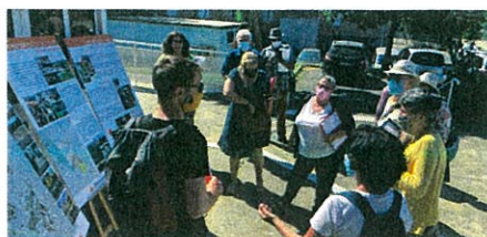
Une visite guidée, au départ de la maison de projet.

Plusieurs départs étaient répartis tout au long de la journée afin de satisfaire un maximum de curieux.