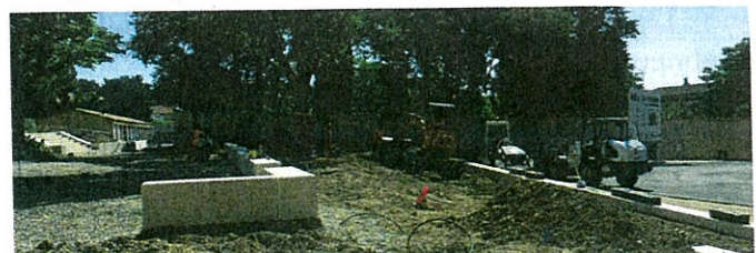
Le square Montaigne

Une amorce des futurs espaces publics est déjà visible à l'image du square Montaigne en travaux.